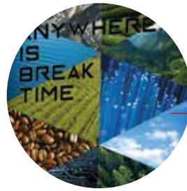
Anywhere is break time