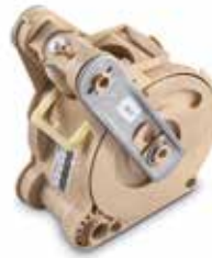
Ein patentierter Kaffeebrüher für einen perfekten Kaffee